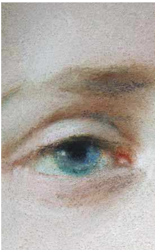
Fot. 5. Przetarcie warstwy barwnej – Emilia Dukszyńska-Dukszta, Portret Michaliny z Międzyńskich Zaborowskiej , 1873, pastel, pergamin na płótnie, fragment, MNW (nr inw. 164044 MNW)

osypywania się i jest niezwykle wrażliwa na uszkodzenia mechaniczne, takie jak przetarcia czy zarysowania (fot. 5). Wszelkie powierzchniowe zabrudzenia są dość trudne do usunięcia bez naruszenia oryginalnej struktury, a ewentualny kontakt z wilgocią może spowodować zacieki oraz niepożądany efekt migracji pigmentów (fot. 6). Przebarwienia mogą powstać na skutek reakcji fizykochemicznych zachodzących pod wpływem użycia utrwalaczy lub też wynikać z procesów starzenia się podłoża czy użytego medium.