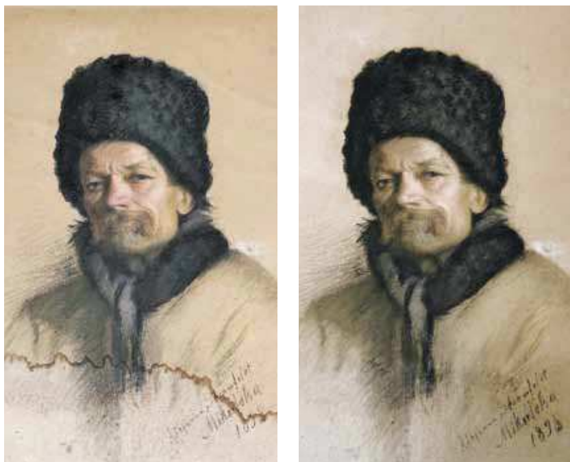
Fot. 6. Zniszczenie w postaci zacieku – Adrianna Stromfeldt-Mikulska, Portret chłopca w futrzanej czapie , 1898, pastel, papier, MNW (nr inw. 34468 MNW), stan przed i po konserwacji

które determinują również wewnętrzne czynniki starzenia. Podstawowym składnikiem papieru są włókna celulozy, może on również zawierać dodatki masowe w postaci wypełniaczy (substancji mineralnych) 25 , substancji zaklejających 26 ,